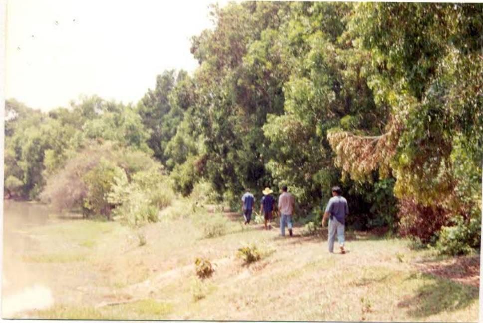
ภาพถ่ายสภาพพื้นที่ป่าบ้านหนองแวงเหนือ หมู่ที่ 7 ตำบลหนองบัวลำภู อำเภอยางสีสุราช จังหวัดมหาสารคาม