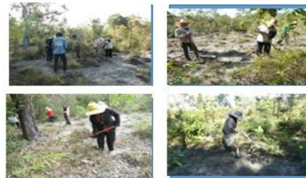
ภาพผลการบำรุงป่า (สภาพปัจจุบัน หลังวันที่ ๓๑ ก.ค. ๕๘)