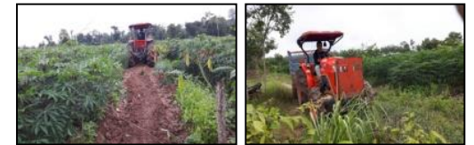
ภาพแสดงผลการดำเนินกิจกรรมปลูกป่า (ระหว่างดำเนินการและหลังดำเนินการ)