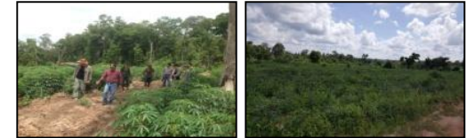
ภาพพื้นที่ก่อนดำเนินการ