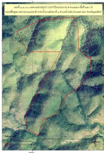
ภาพถ่ายทางอากาศสี ปี ๒๕๔๕