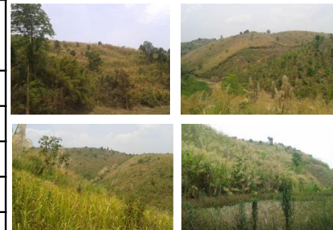
ภาพผลการปลูกปีที่ ๑ (สภาพปัจจุบัน หลังวันที่ ๓๐ก.ย.๕๙)