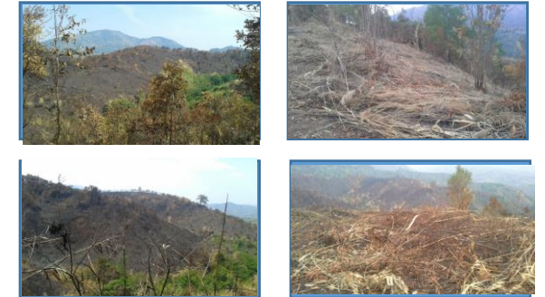
ภาพแสดงผลการดำเนินกิจกรรมปลูกป่า (ระหว่างดำเนินการและหลังดำเนินการ)