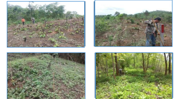
ภาพแสดงผลการดำเนินกิจกรรมปลูกป่า (ระหว่างดำเนินการและหลังดำเนินการ)