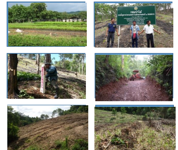
ภาพแสดงผลการดำเนินกิจกรรมปลูกป่า (ระหว่างดำเนินการและหลังดำเนินการ)