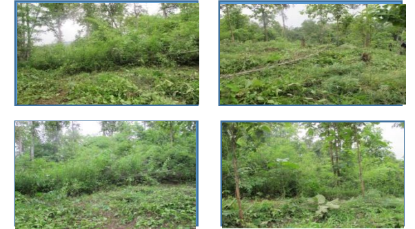
ภาพพื้นที่ก่อนดำเนินการ