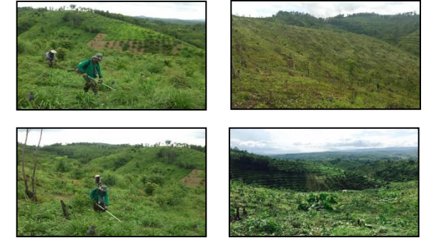
ภาพแสดงผลการดำเนินกิจกรรมปลูกป่า (ระหว่างดำเนินการและหลังดำเนินการ)