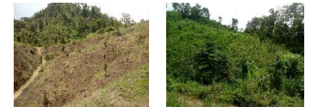
ภาพผลการปลูกป่าปีที่ 2 (สภาพปัจจุบัน หลังวันที่ 30 ก.ย. 59)