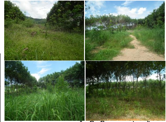
ภาพแสดงผลการดำเนินกิจกรรมปลูกป่า (ระหว่างดำเนินการและหลังดำเนินการ)