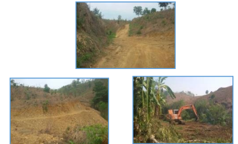
ภาพผลการปลูกป่าปีที่ ๑ (สภาพปัจจุบัน หลังวันที่ ๓๐ ก.ย.๕๙)