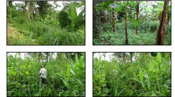
ภาพแสดงผลการดำเนินกิจกรรมปลูกป่า (ระหว่างดำเนินการและหลังดำเนินการ)