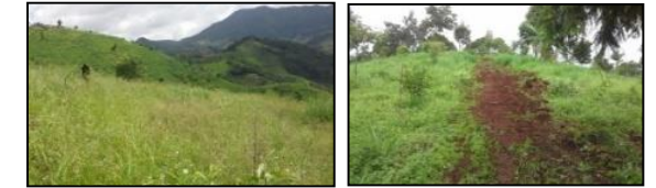
ภาพแสดงผลการดำเนินกิจกรรมปลูกป่า (ระหว่างดำเนินการและหลังดำเนินการ)