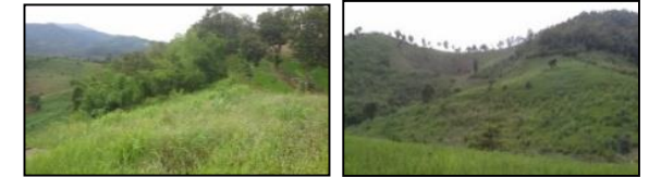
ภาพพื้นที่ก่อนดำเนินการ