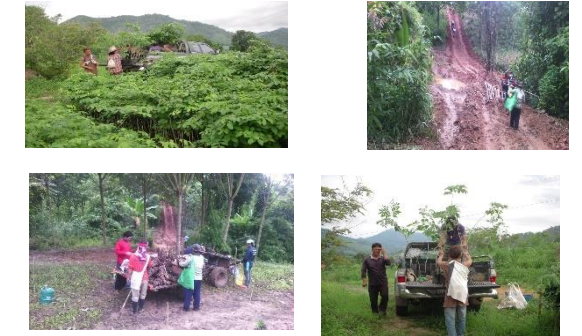
ภาพผลการปลูกป่าปีที่ 1 (สภาพปัจจุบัน หลังวันที่ 31 ก.ค. 58)