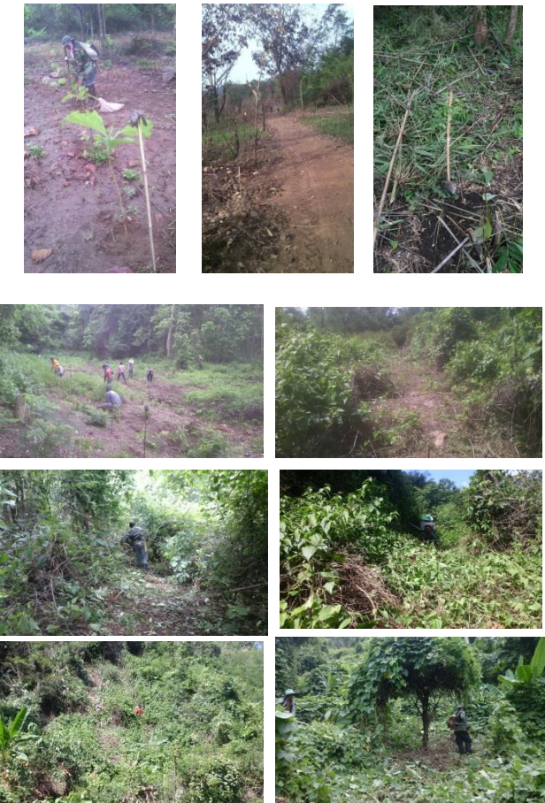
ภาพผลการบำรุงป่า (สภาพปัจจุบัน หลังวันที่ 31 ก.ค. 58)