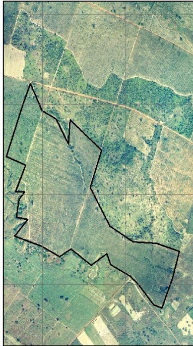
ภาพถ่ายทางอากาศ