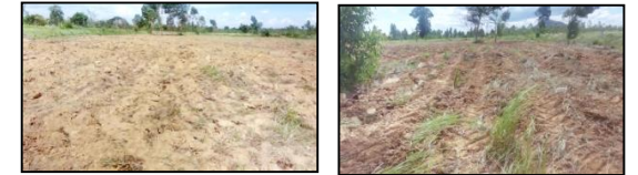
ภาพพื้นที่ก่อนดำเนินการ