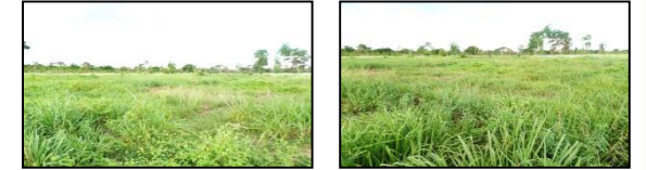
ภาพพื้นที่ก่อนดำเนินการ