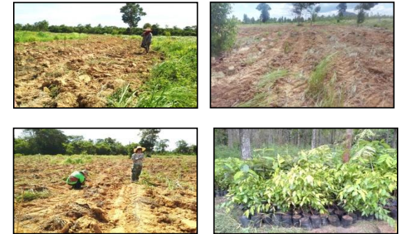
ภาพแสดงผลการดำเนินกิจกรรมปลูกป่า (ระหว่างดำเนินการและหลังดำเนินการ)