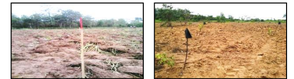
ภาพแสดงผลการดำเนินกิจกรรมปลูกป่า (ระหว่างดำเนินการและหลังดำเนินการ)