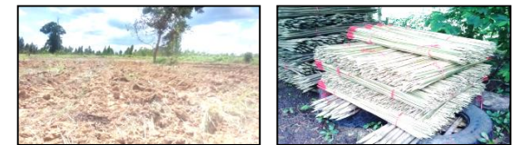
ภาพแสดงผลการดำเนินกิจกรรมปลูกป่า (ระหว่างดำเนินการและหลังดำเนินการ)