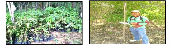
ภาพแสดงผลการดำเนินกิจกรรมปลูกป่า (ระหว่างดำเนินการและหลังดำเนินการ)