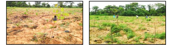
ภาพพื้นที่ก่อนดำเนินการ