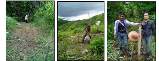
ภาพแสดงผลการดำเนินกิจกรรมปลูกป่า (ระหว่างดำเนินการและหลังดำเนินการ)