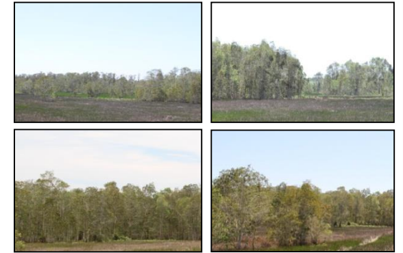
ภาพแสดงผลการดำเนินการกิจกรรมปลูกป่า (ระหว่างดำเนินการและหลังดำเนินการ)