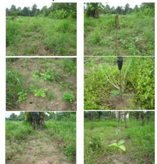
(สภาพปัจจุบัน หลังวันที่ ๓๑ ก.ค. ๕๗)